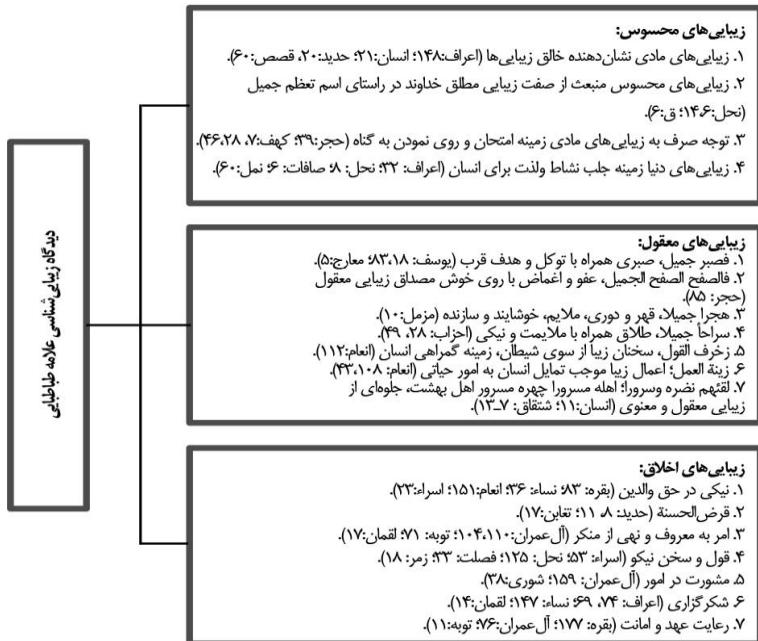
(نمودار شماره ۱)

در خاتمه این بحث دیدگاه زیبایی‌شناسانه علامه طباطبائی در نموداری به شرح ذیل خلاصه گردیده است: